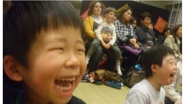
バーバンのHP トップに載った笑顔の写真 http://www.afutafu-barban.org/

皆さんに教えてもらった「回覧板」のゲームや「なんでもバスケット」「震源地」などをやって、とっても楽しい時間を過ごしました。